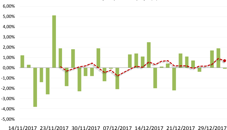
Petrobras | Ajustes nos preços da Gasolina desde a mudança na política de preços (%)