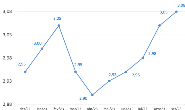
Curva de Preços Futuros NY

R$/litro | com impostos | Entrega ao Final do Mês | Base Ribeirão Preto